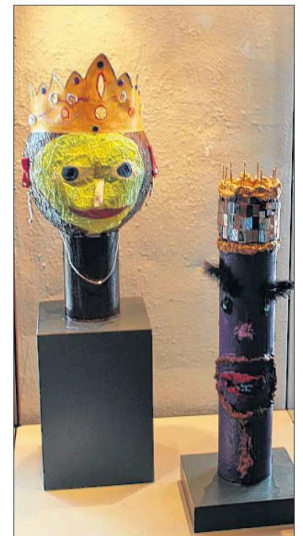
Sogar „Sissi und Franz“ geben sich die Ehre.